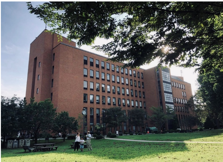
© Olga Mut (Outgoing WS 19/20)